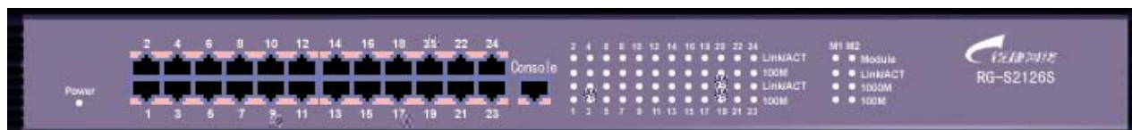
图 2-2 S2126S 前面板图

如图 2-2 所示 ,S2126S 智能型千兆以太网交换机的前面板包括 Console 端口、24 个 10Base-T/100Base-TX RJ45 端口、LED 指示灯。