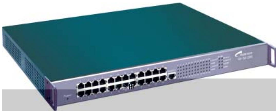
图 2-1 S2126S 产品外观图

产品尺寸 : ( W × H × L ) 440mm × 44mm × 240mm